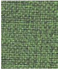
Fair Isle EJ186